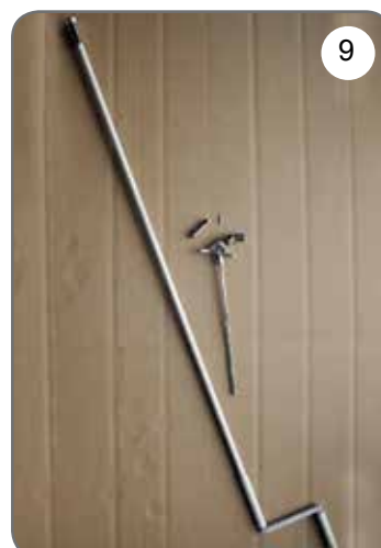
Korba, przegub Cardana 45° lub 90° z zaczepem dzwinkowym [9].