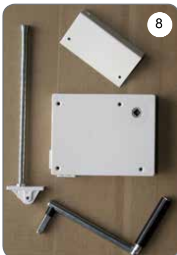
Kaseta z przekładnią na linkę, płytka do mocowania kasety, prowadnica linki, korba [8].