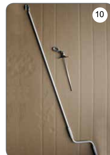
Korba, przegub Cardana 45° lub 90° z uchem [10].