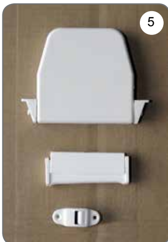
Zwijacz na taśmę (pasek), prowadnica taśmy (paska), uchwyt taśmy (paska) [5].

b) Rodzaje stosowanych napędów ręcznych (opcje):