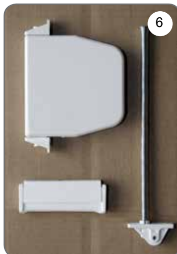
Zwijacz na linkę, prowadnica linki, uchwyt linki [6].