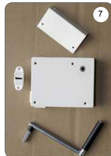
Kaseta z przekładnią na taśmę (pasek), płytka do mocowania kasety, prowadnica taśmy (paska), korba [7].